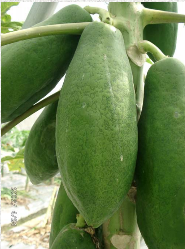
圖一、木瓜輪點病毒於木瓜果實上形成輪紋病徵