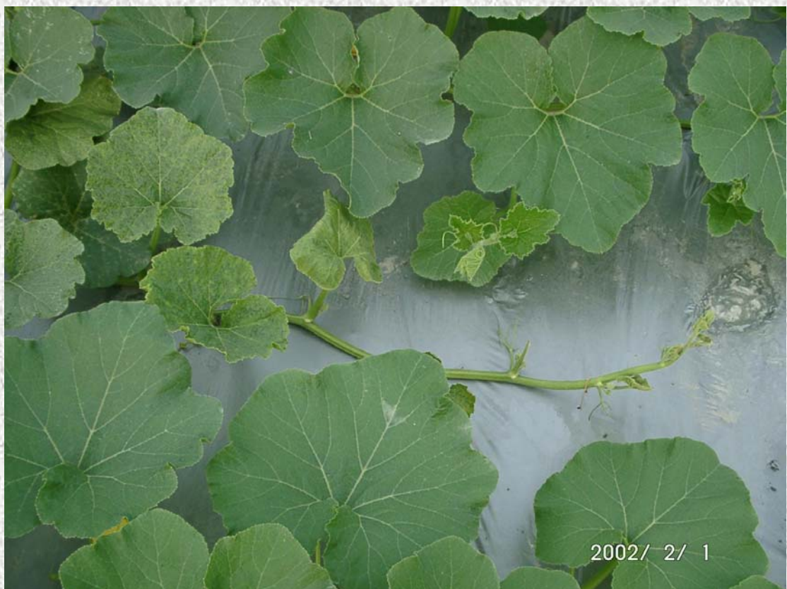
圖三、夏南瓜黃化嵌紋病毒在南瓜上造成葉片嵌紋