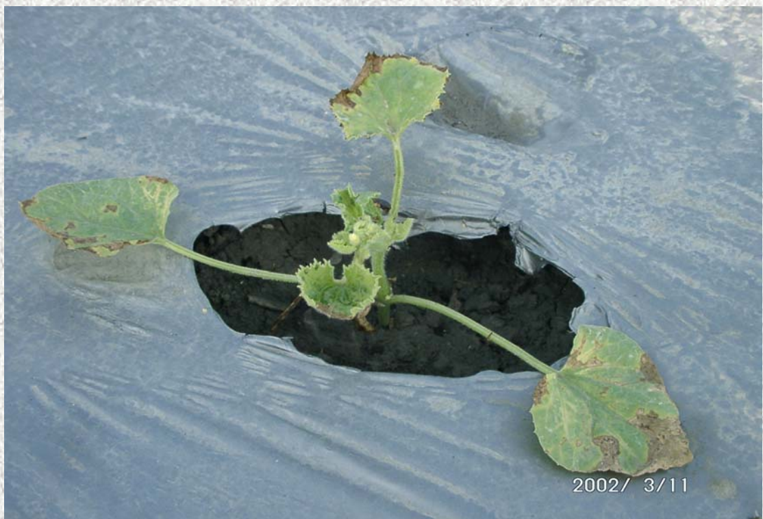
圖二、夏南瓜黃化嵌紋病毒造成洋香瓜植株嚴重矮化，且葉片嵌紋變小。